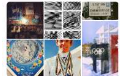
Jeux Olympiques 1968 Chamrousse 34 épingles