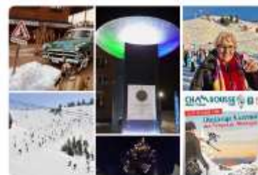
50 ans Jeux Olympiques Chamrousse 28 épingles

Augmentation 20% du nombre d'abonnés (15)